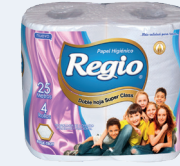
Regio DH Super Class 12050402