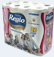
Regio Super Familia 1203082