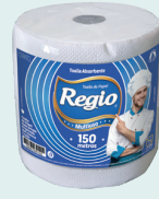
Regio Multiuso 1301012