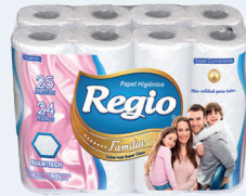
Regio Familia 12050403