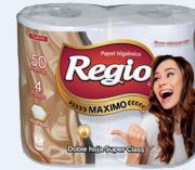
Regio Máximo 12050404