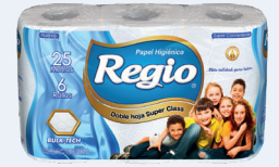
Regio DH Super Class 12050401