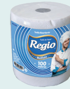
Regio Multiuso 1301011