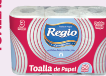
Regio Conveniente 1312620