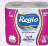
Regio DH Conveniente 12020480