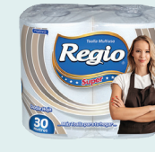
Regio Super 1312612