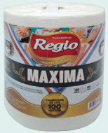
Regio MAXIMA 1312660