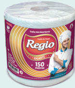
Regio Gigante 1301013