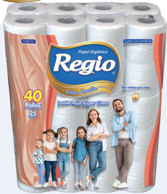
Regio Gran Familia 12025800